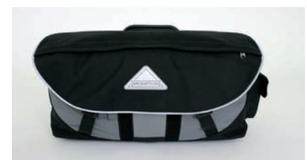
geschlossene S-Bag - Maße: ca. 40x18x25cm LxBxH

alle älteren Räder mit diesem Clip ausgestattet werden. Bestellen Sie das Nachrüst-Set jetzt gleich! Nachrüst-Set kpl. Hinterbau-Clip EUR 36,- Art.Nr.: retqrf (Lieferung ohne Gummiblock, da der „alte“ weiter verwendet werden kann)