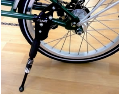
Hinterbau-Ständer für's Brompton

Wir freuen uns, Ihnen in Zusammenarbeit mit der Firma Humpert einen exklusiv über uns zu beziehenden Alu-Ständer für's