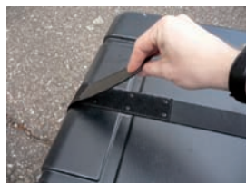
mit integriertem Kofferband

Am Zielort angekommen, lässt sich die Roller-Bag zu einem handlichen Paket zusammenrollen. Gewicht: 2,8 kg