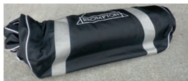
Tasche gerollt: 60 x 25 x 15 cm (LxBxH)