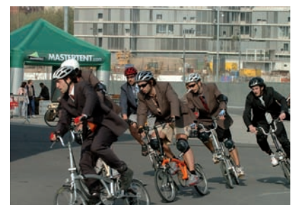
BWC 2007 in Barcelona

alle älteren Räder mit diesem Clip ausgestattet werden. Bestellen Sie das Nachrüst-Set jetzt gleich! Nachrüst-Set kpl. Hinterbau-Clip EUR 36,- Art.Nr.: retqrf (Lieferung ohne Gummiblock, da der „alte“ weiter verwendet werden kann)