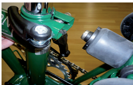
neuer Schnellspanner m. Hinterbau-Clip

Über den ständig herunterklappenden Hinterbau brauchen Sie sich zukünftig nicht mehr zu ärgern. Der neue Clip sorgt dafür, dass der Hinterbau beim Auseinanderfallen automatisch