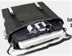
Extra Laptopfach: 38 x 24 x 6cm

alle City-Folder Fronttaschen besitzen ein extra gepolstertes Fach für Laptop und andere empfindliche Geräte.