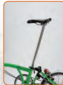
Verlängerte und verstärkte Sattelstütze Ab ca. 1,78 m Körpergröße zu empfehlen

Wer auf einen herkömmlichen Ständer nicht verzichten möchte, kann diesen auch am Brompton montiert bekommen. Die Luftpumpe wird dann lose beigelegt.